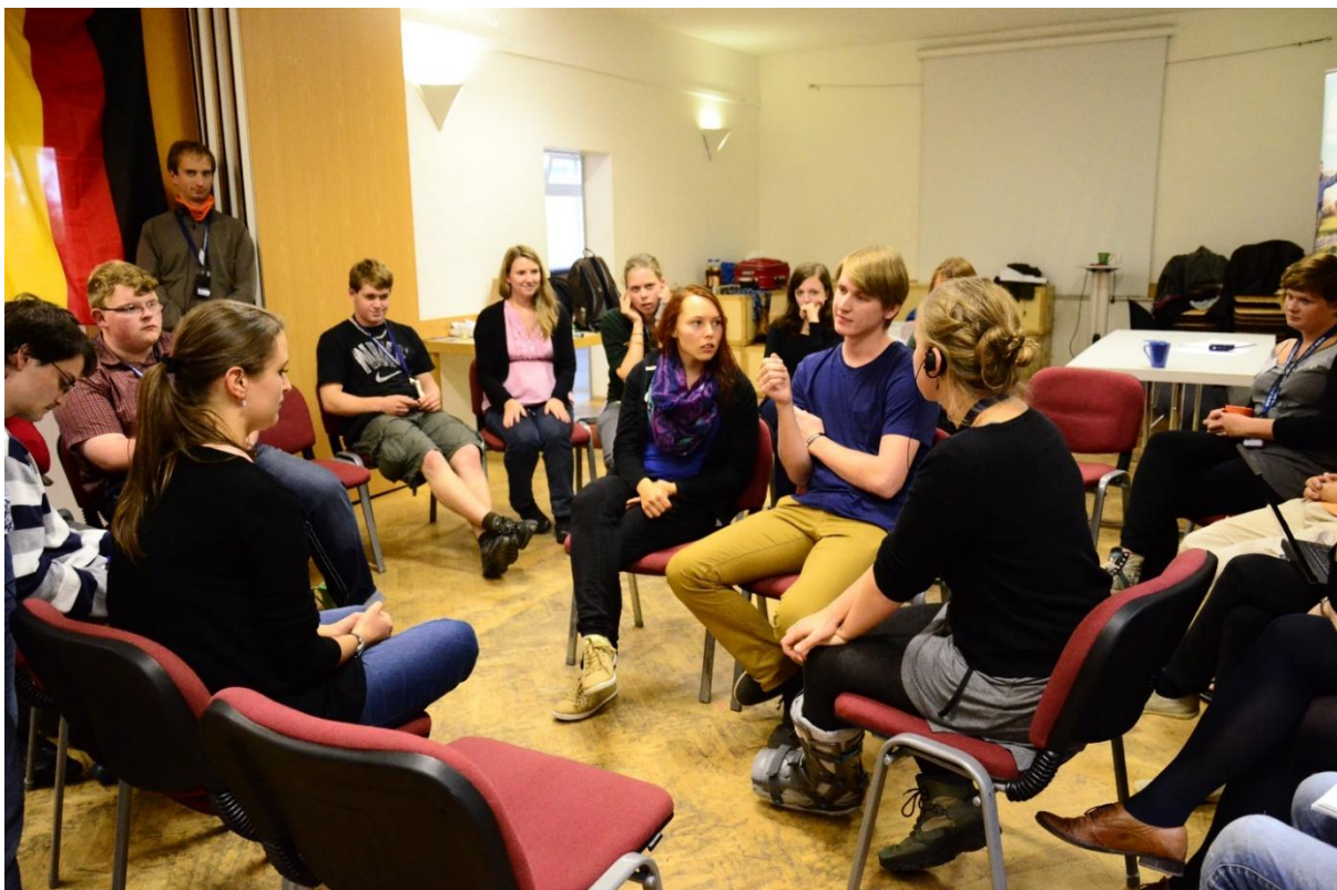
Tréning diskuzních metod, 2. plenární zasedání

Více materiálů, aktualit nebo rozhovorů se členy naleznete na webových stránkách www.cnfm.cz a www.dtjf.de