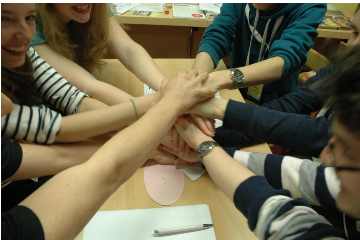
První pracovní skupina je na světě! 1. plenární zasedání, PS „Zapoj se! / Misch mit!“