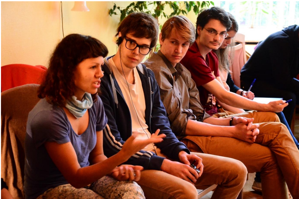
Plenární diskuze, 2. plenární zasedání